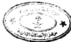
عبدالله بن عبدالعزيز